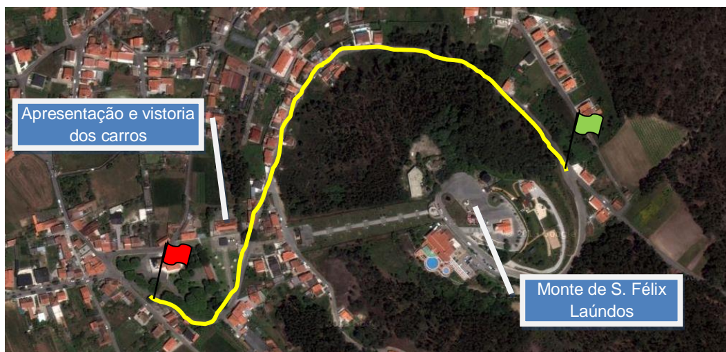
Figura 2: Percurso da prova (gps +41° 26' 4.02", -8° 43' 7.85")

O percurso da prova está indicado na Figura 2.